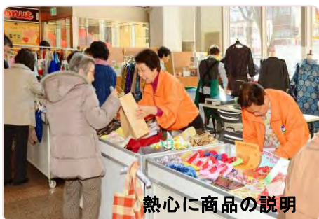
熱心に商品の説明

女性会員の獲得と就業の機会拡大を目的に、楽しく・元気で働く女性会員の姿を紹介するイベント