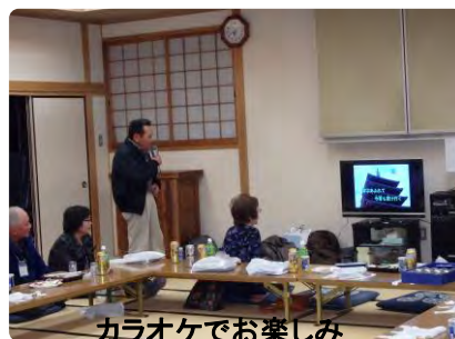
カラオケでお楽しみ

はじめは遠慮していた会員も、時間とともに楽しく歌い、みんなで拍手をするようになりました。