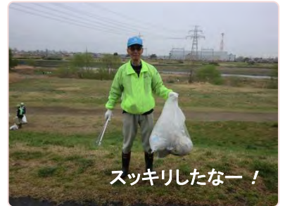
スッキリしたなー!

4月5日、花曇りのなか、多摩川清掃(多摩川緑地周辺と北緑地周辺)が実施され、35名の会員が参加しました。参加された会員の皆様はお疲れ様でした。