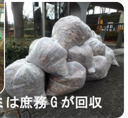
ゴミは庶務Gが回収

屋外作業なので、夏場は暑く冬場は寒い厳しさがありますが、多くの市民が利用する公園をキレイにするやりがいを実感できる仕事です。