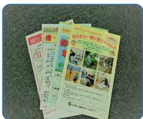
広報紙 パンフレット