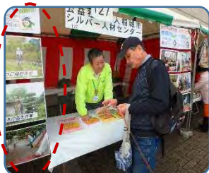
仕事紹介パネル (市民祭・平尾まつり)

第1回「シルバー写真コンクール」の実施要項は3月の地区会資料と一緒に配付し、ホームページに掲載します。(総務部 広報委員会)