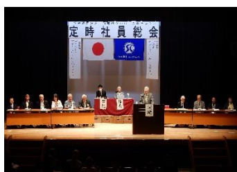
大野監事による監査報告