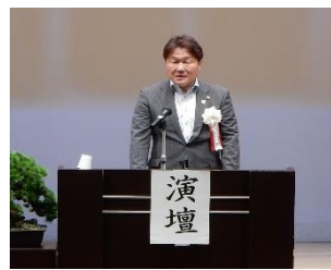
高橋勝浩市長挨拶