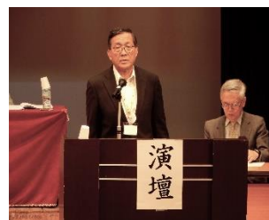
武田理事による予算等報告