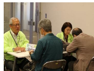
紹介ブースでの入会相談会